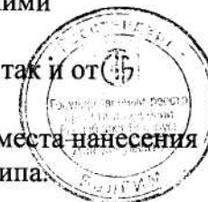
Схема пломбировки весов от несанкционированного доступа с указанием места нанесения знака поверки в виде клейма-наклейки приведена в Приложении А к описанию типа.

Питание весов может осуществляться как через адаптер сетевого питания, так и от встроенной аккумуляторной батареи.