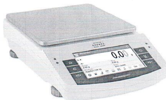
весы модификации XN