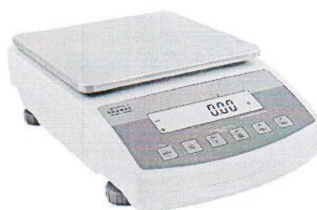
весы модификации C/2/N