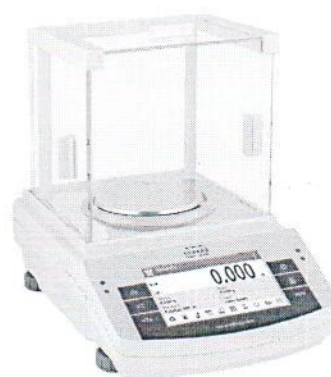
весы модификации XN