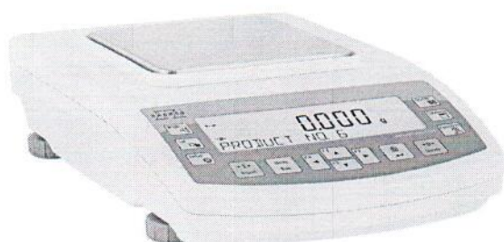
весы модификации C/2/N