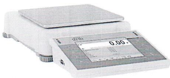
весы модификации Y