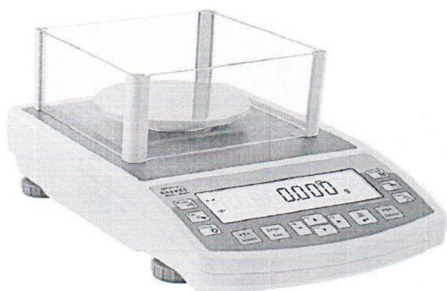
весы модификации NH