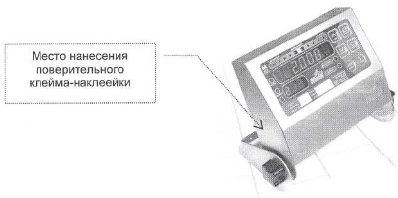
Схема пломбировки весов от несанкционированного доступа и указание мест нанесения поверительного клейма-наклейки и оттисков поверительный клейм, содержащих знак поверки средств измерений