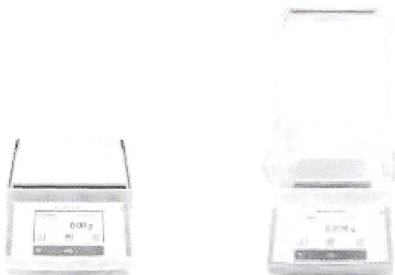
Рисунок 1 Внешний вид весов лабораторных XS Precision