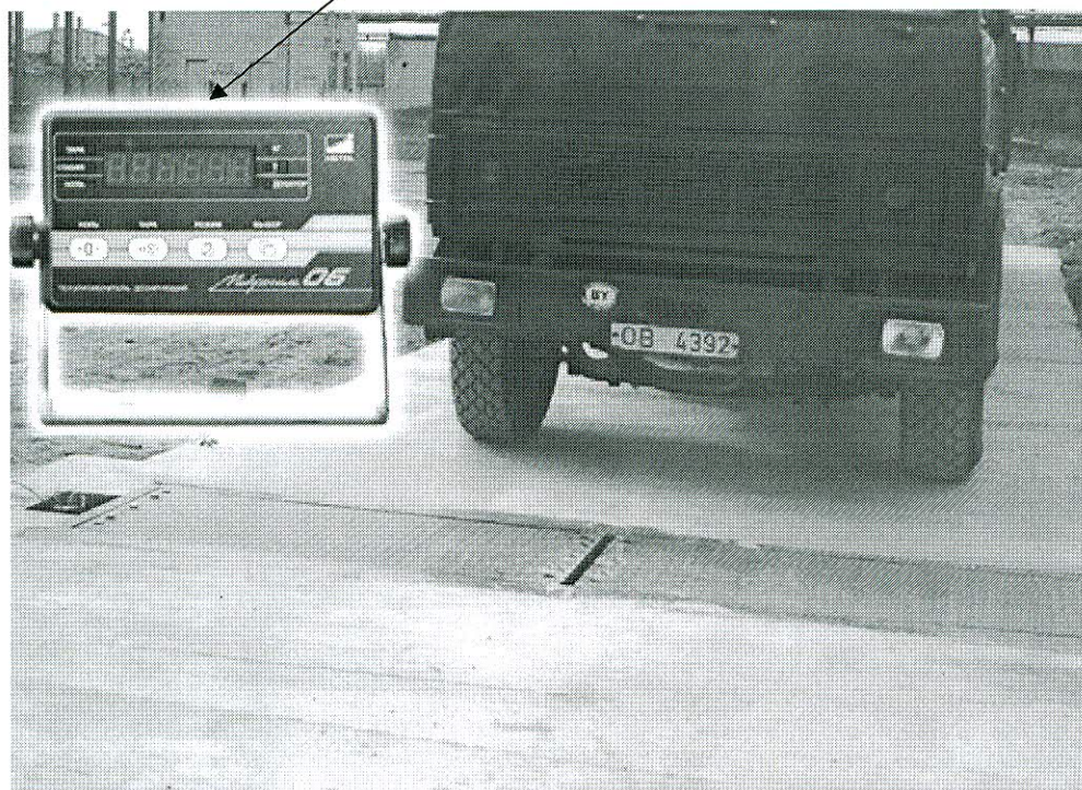
Рисунок 1 – Общий вид весов ВДА-20