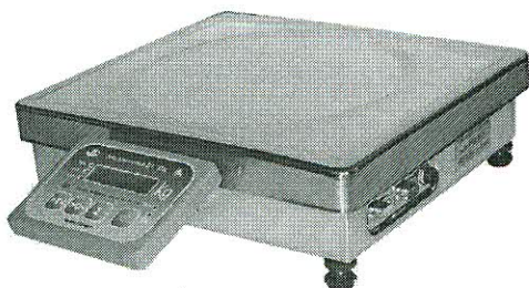
Рисунок 1 Внешний вид весов ВЭ-6, ВЭ-15, ВЭ-30

Внешний вид весов приведен на рисунках 1, 2. Схема пломбировки весов от несанкционированного доступа показаны на рисунках 1, 2, 3 приложения 1.