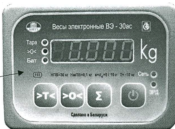
Рисунок 5 Место расположения наклейки на весы ВЭ-6, ВЭ-15, ВЭ-30, ВЭ-150, ВЭ-300 (дискретное отсчетное устройство – вид сверху)

Место расположения наклейки государственного поверителя