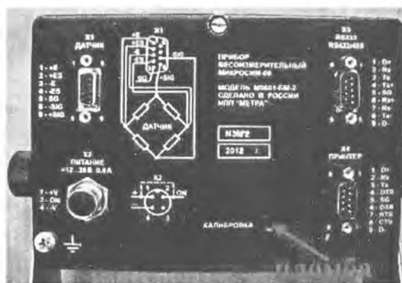
Рисунок 2 Общий вид и место пломбирования Микросим 06

Идентификация и защита метрологически значимой части встроенного программного обеспечения (ПО) весов, а также параметров калибровки (юстировки) от воздействий производится с помощью пломбирования индикатора весов, отображения при включении весов значений версии ПО и контрольной суммы блоков параметров калибровки (электронное клеймо), а в случае модификаций с компьютерным ПО – программно, с использованием электронного ключа защиты и электронного клейма.