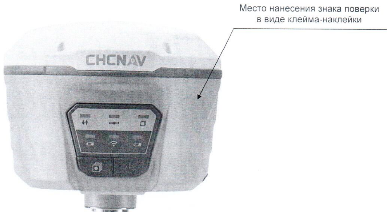
Рисунок А.1 – Место нанесения знака поверки в виде клейма-наклейки

Место нанесения знака поверки в виде клейма-наклейки