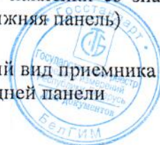
Рисунок 2 – Внешний вид приемника со стороны задней панели

а – место пломбировки б – место нанесения наклейки со знаком утверждения типа (нижняя панель)