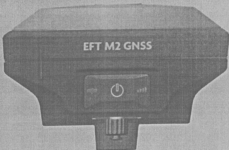
Рисунок 1 – Внешний вид приемника со стороны передней панели

Внешний вид приемника с указанием места пломбировки от несанкционированного доступа и места нанесения знака утверждения типа приведен на рисунке 1.