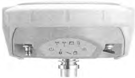
ZENITH 25 PRO