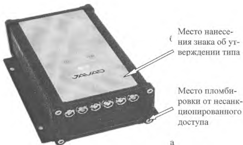
Рисунок 1 - Общий вид приемника

Конструктивно приемники выполнены в корпусе из легкого сплава с внешней GNSS-антенной. На верхней панели находятся три кнопки и два трехцветных светодиода, образующие пользовательский интерфейс TriPad. Этот интерфейс имеет несколько функций: включение/выключение приемника и записи данных; контроль количества отслеживаемых спутников, источника питания, работы модема и модуля Bluetooth. На передней панели установлены: разъемы для антенного кабеля, для сетевых подключений, для подключения внешнего электропитания и последовательные порты RS-232. Электропитание осуществляется от встроенной перезаряжаемой литиево-ионной батареи. Связь с внешними устройствами осуществляется через USB и последовательные порты, а также через модуль беспроводного канала передачи данных Bluetooth и порт Ethernet. Имеется возможность подключать внешний источник электропитания. Допускается подключение к приемникам полевого контроллера, что позволяет полностью контролировать измерительный процесс в полевых условиях и гарантировать качество выполняемой работы. При приеме сигналов ГЛОНАСС осуществляется непрерывная калибровка в реальном времени задержек этих сигналов во всех частотных каналах. Внешний вид приемника приведен на рисунке 1.