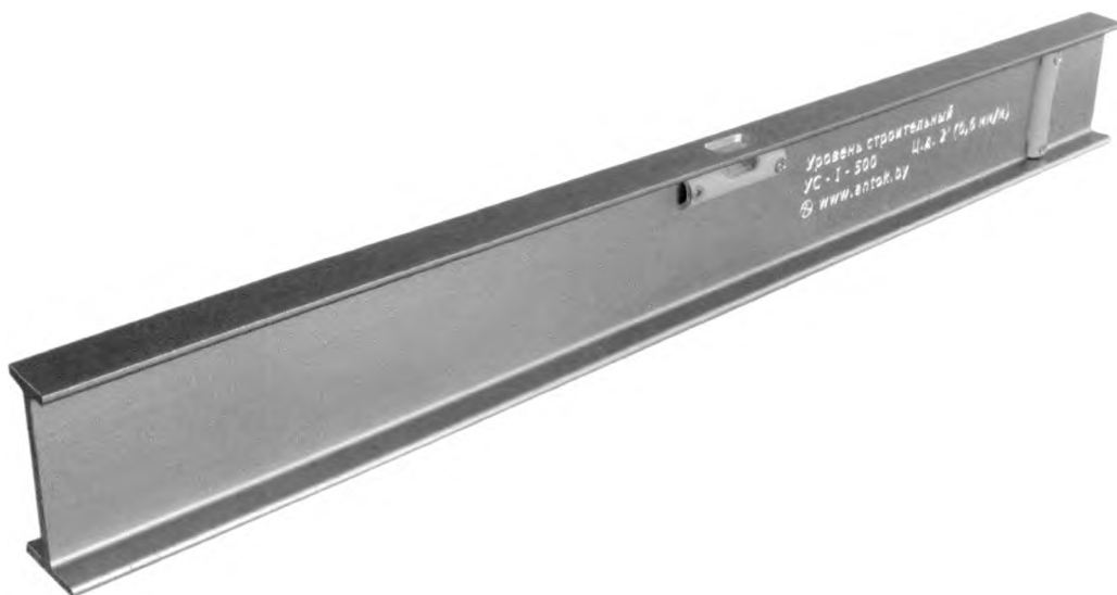
Рисунок 1 – Общий вид уровня УС

Оттиски знака поверки и штампа ОТК изготовителя ставят в Паспорт на уровень. Место нанесения знака поверки в виде клейма-наклейки приведено в приложении Б.