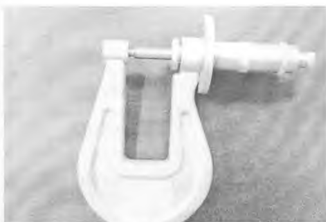
Рисунок 3 – Внешний вид микрометров типа МЛ