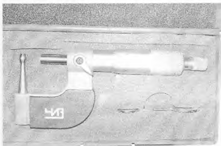
Рисунок 4 – Внешний вид микрометров типа МТ