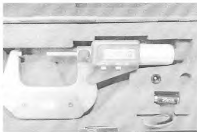
Рисунок 2 – Внешний вид микрометров типа МК