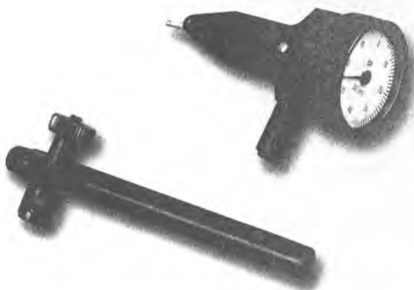
Рисунок 2 – Общий вид индикаторов ИРТ

ИРТ – торцевые со шкалами, перпендикулярными к оси измерительного рычага в среднем положении и к плоскости его поворота (рисунок 2).