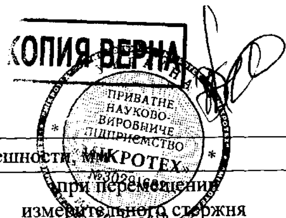
Продолжение таблицы 4